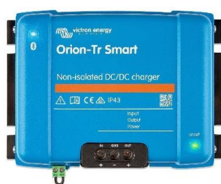
Figure 2 : Orion non isolé