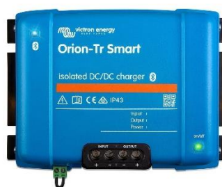
Figure 3 : Orion isolé

Vous devez sûrement vous demander si votre Orion isolé va bien fonctionner si vous reliez les deux négatifs à votre châssis mais à différents endroits dans le véhicule. La réponse est OUI , il va fonctionner parfaitement peu importe la situation , cela va juste la plupart du temps « casser » votre isolation galvanique.