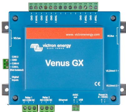
Venus GX avec connecteurs