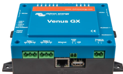
Venus GX – vue de face